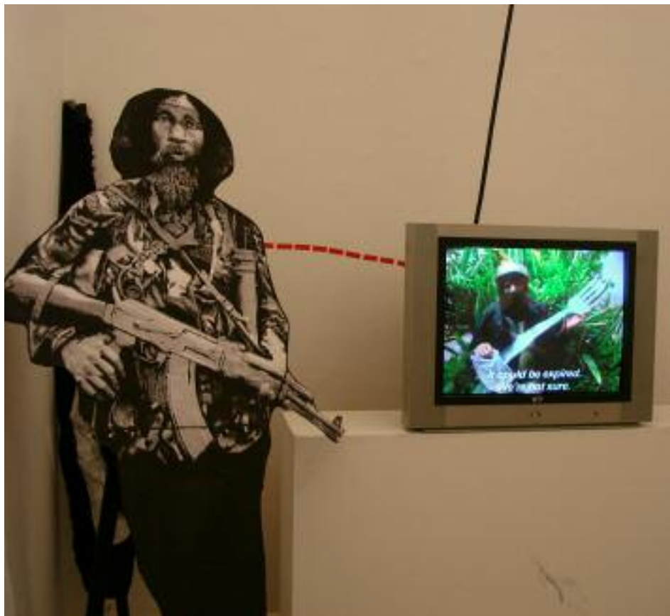
10 y 11